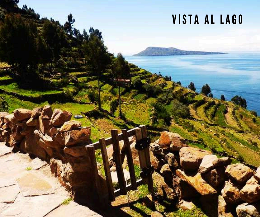
VISTA AL LAGO