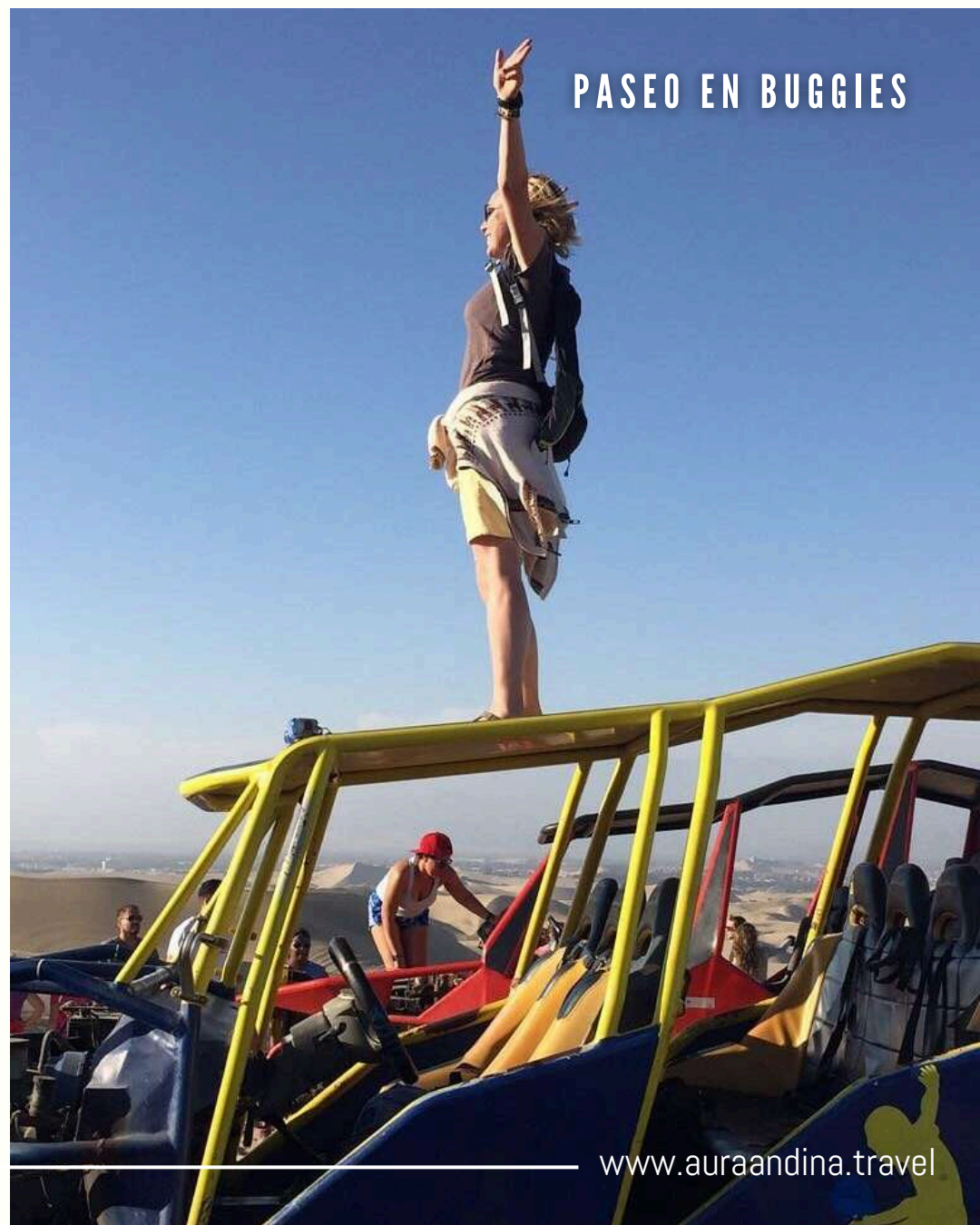
PASEO EN BUGGIES