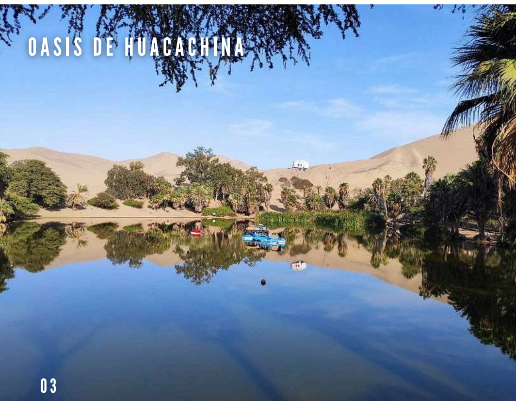
OASIS DE HUACACHINA