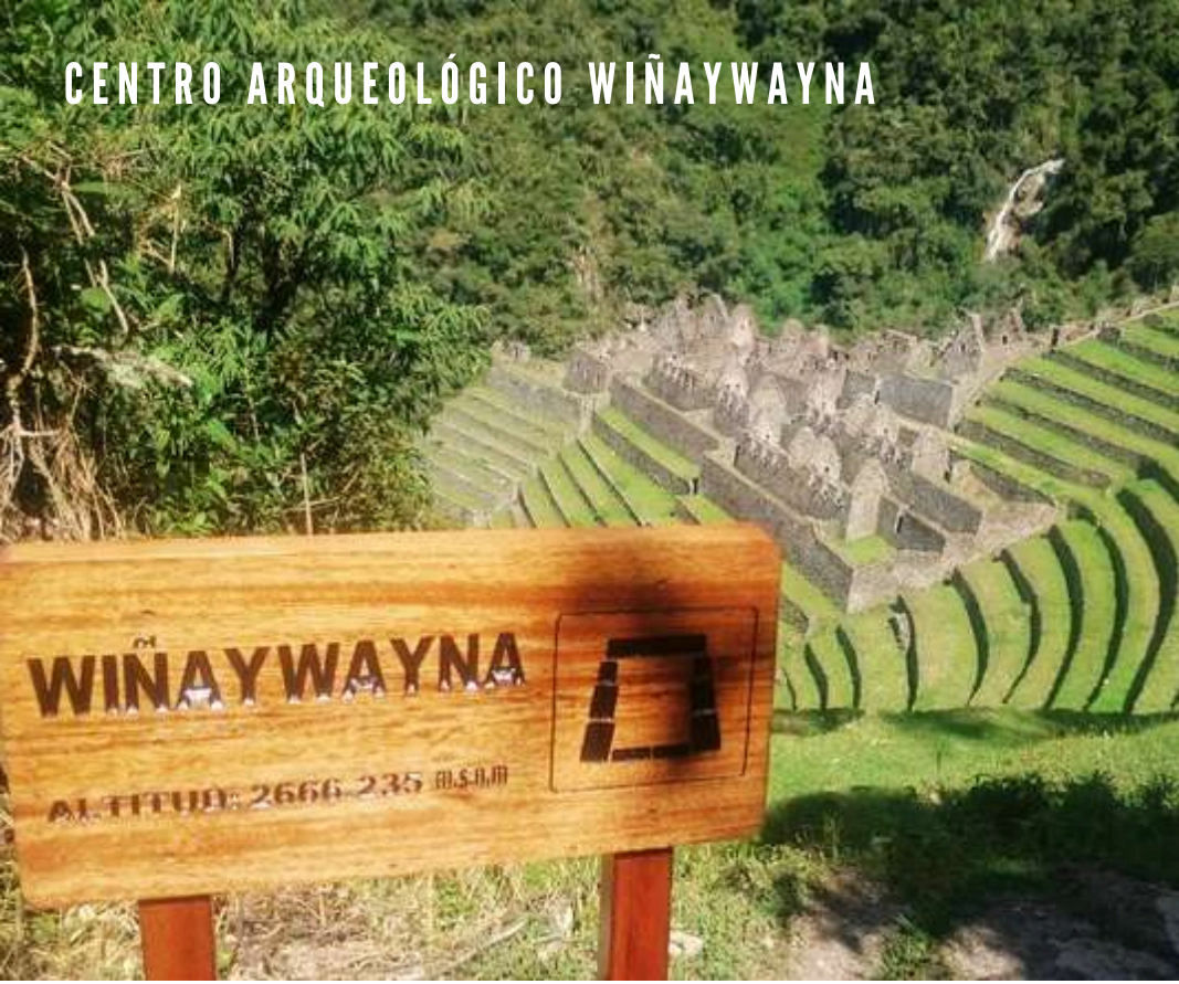
CENTRO ARQUEOLÓGICO WIÑAYWAYNA